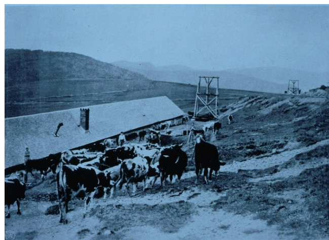
Ferme du Grand Hahnenbrunnen (alt. 1198 m, route des Crêtes)

Voilà encore autre chose! probablement les pylônes du téléphérique Mittlach <-> Kruth (1916) - la photo date-rait de 1924